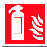
Númer: Slökkveitihútt skúli 15 x 15 cm Númer: Slökkveitihútt skúli 20 x 20 cm