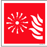
Númer: Brunadandi hútt skúli 15 x 15 cm Númer: Brunadandi hútt skúli 20 x 20 cm