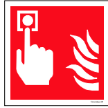
Númer: Brunadandi hútt skúli 15 x 15 cm Númer: Brunadandi hútt skúli 20 x 20 cm