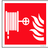
Númer: Brunadanga hútt skúli 15 x 15 cm Númer: Brunadanga hútt skúli 20 x 20 cm