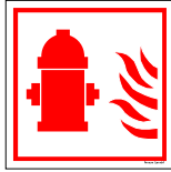
Númer: Brunabútur hútt skúli 15 x 15 cm Númer: Brunabútur hútt skúli 20 x 20 cm