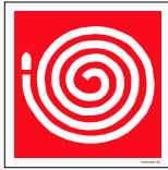
Númer: Brunadanga hútt skúli 15 x 15 cm Númer: Brunadanga hútt skúli 20 x 20 cm