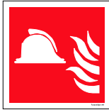
Númer: Slökkveitibútur hútt skúli 15 x 15 cm Númer: Slökkveitibútur hútt skúli 20 x 20 cm