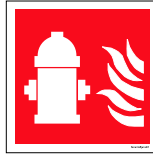
Númer: Brunabútur hútt skúli 15 x 15 cm Númer: Brunabútur hútt skúli 20 x 20 cm