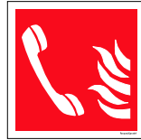
Númer: Neyðarsími hútt skúli 15 x 15 cm Númer: Neyðarsími hútt skúli 20 x 20 cm